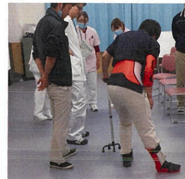
関節の動きを制限されている状況を体験

活動を実施していきたいと思っています。また、周りに脳卒中後遺症でお困りの方がいらっしゃいましたら当院リハビリテーション科までお気軽にお声掛けください。